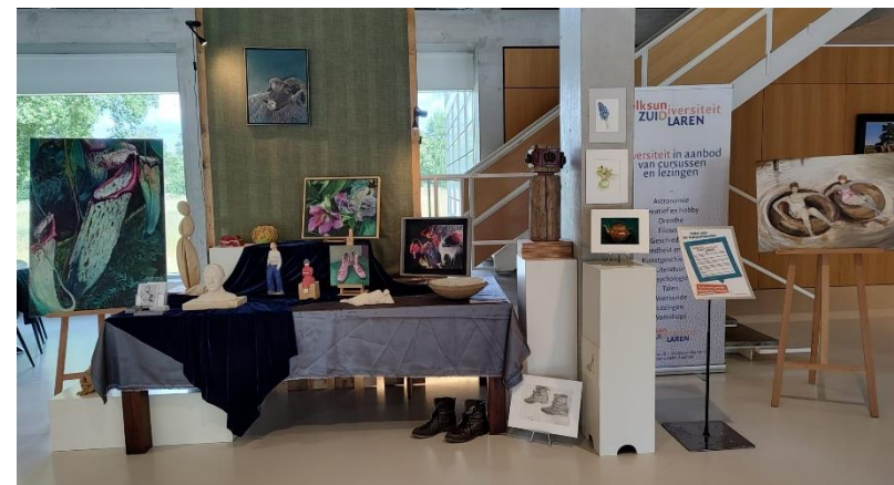
Tafel van de Burgemeester Locatie: gemeentehuis Vries Bezoek: tijdens openingstijden

Meer informatie: https://www.tynaarlo.nl/tafelvandeburgemeester