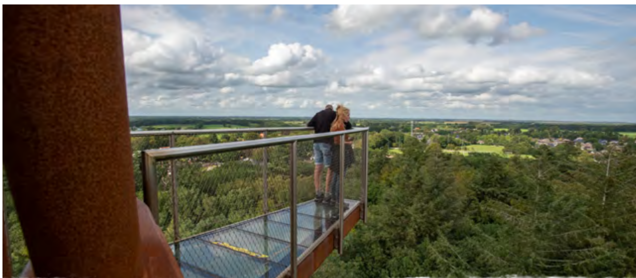
Uitzicht vanaf de Bosbergtoren; Appelscha