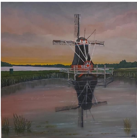
Molen de Helper

We hopen in 2022 weer volop voor publiek open te zijn.