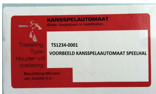
Voorbeeld van een ouder merkteken (Ministerie van Justitie)