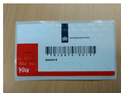
Voorbeeld van een Ksa-merkteken

Speelautomaten in speelautomatenhallen kunnen meerdere spelersplaatsen hebben. Elke spelersplaats heeft een eigen merkteken. Het aantal spelersplaatsen kan worden geteld door het aantal merktekens op te tellen. Het aantal zitplaatsen moet hiermee overeenkomen. Het aantal speelautomaten kunnen worden geteld door het aantal merktekens te tellen met een unieke waarde. Hieronder staat een voorbeeld beschreven: