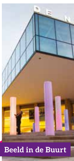
Beeld in de Buurt