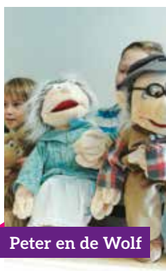
Peter en de Wolf