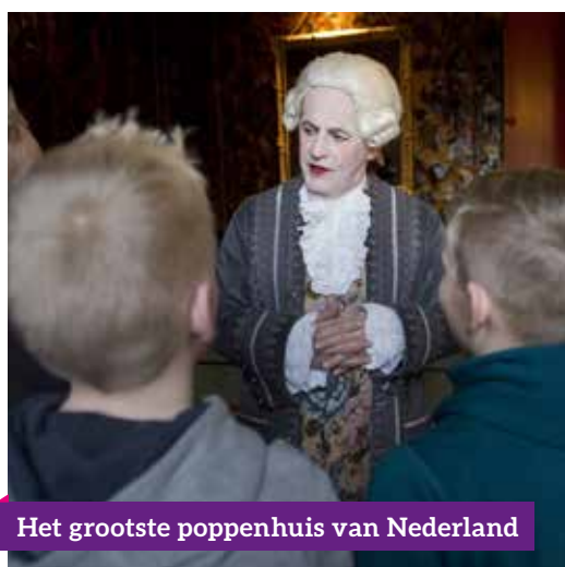
Het grootste poppenhuis van Nederland