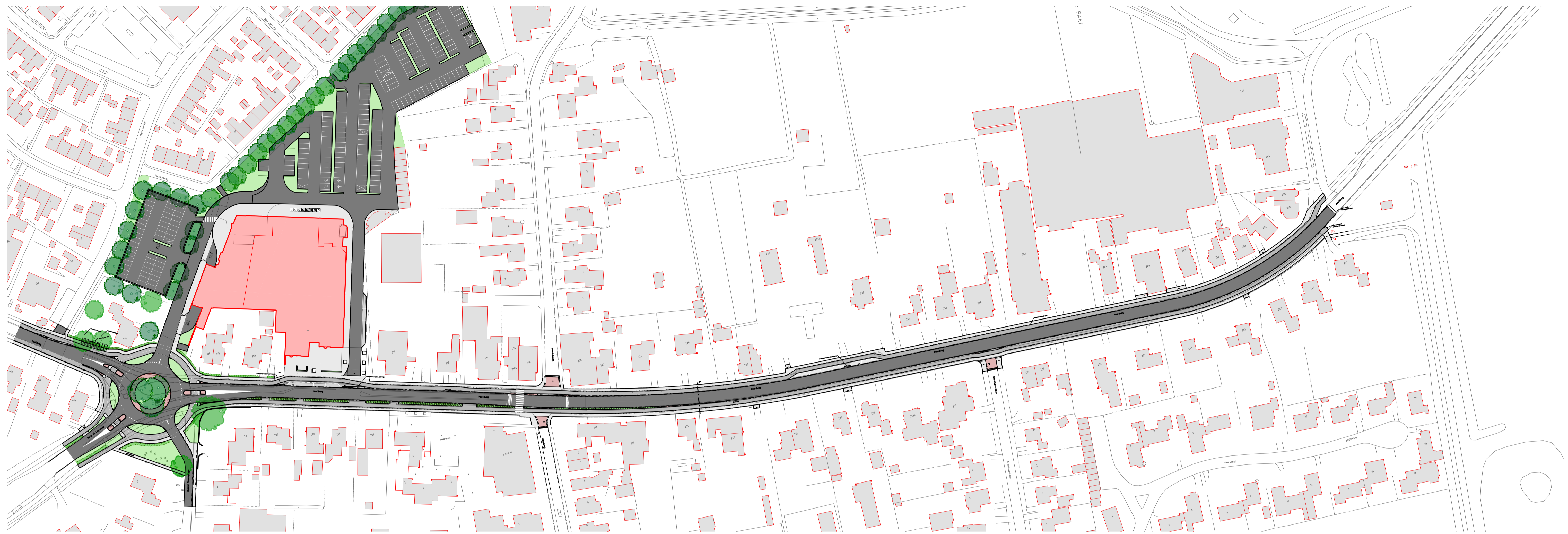
Situatie schaal 1:1000