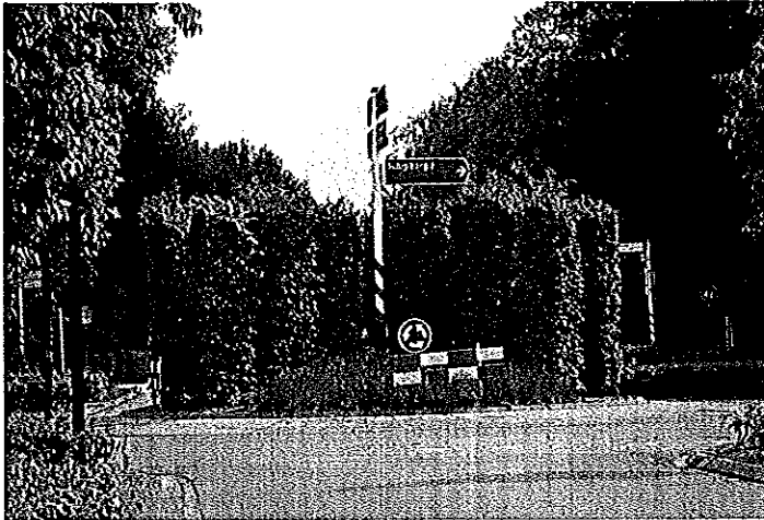
Rotonde Zuidlaren in een groene omgeving