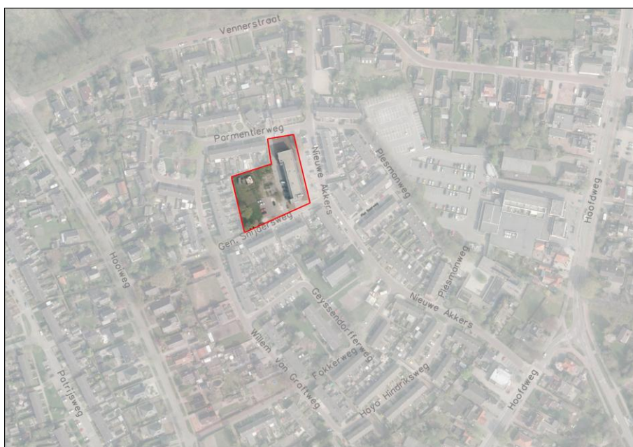
Luchtfoto omgeving plangebied

Op navolgende luchtfoto is het plangebied rood omkaderd.