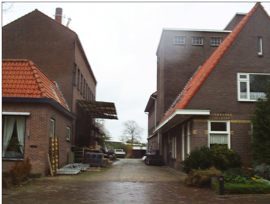
Woonhuizen met daarachter de oude melkfabriek

De bebouwing op het ACM/Van der Vinneterrein bestaat uit woonhuizen met daarachter bedrijfsbebouwing. Hierdoor staan de woningen dicht op de weg. De vier woningen bestaan, op één uitzondering na, uit één bouwlaag met kap. Opvallend zijn de dakpannen in oranje kleurstelling.