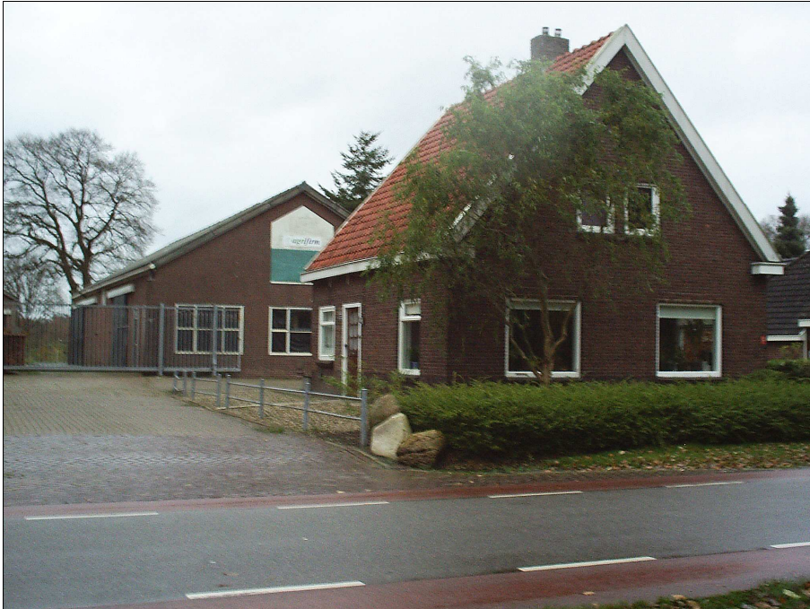
Bedrijfsbebouwing achter de woning