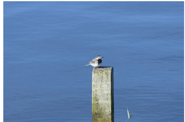
(spreeuwen op de molen en kwikstaart op meerpaal)