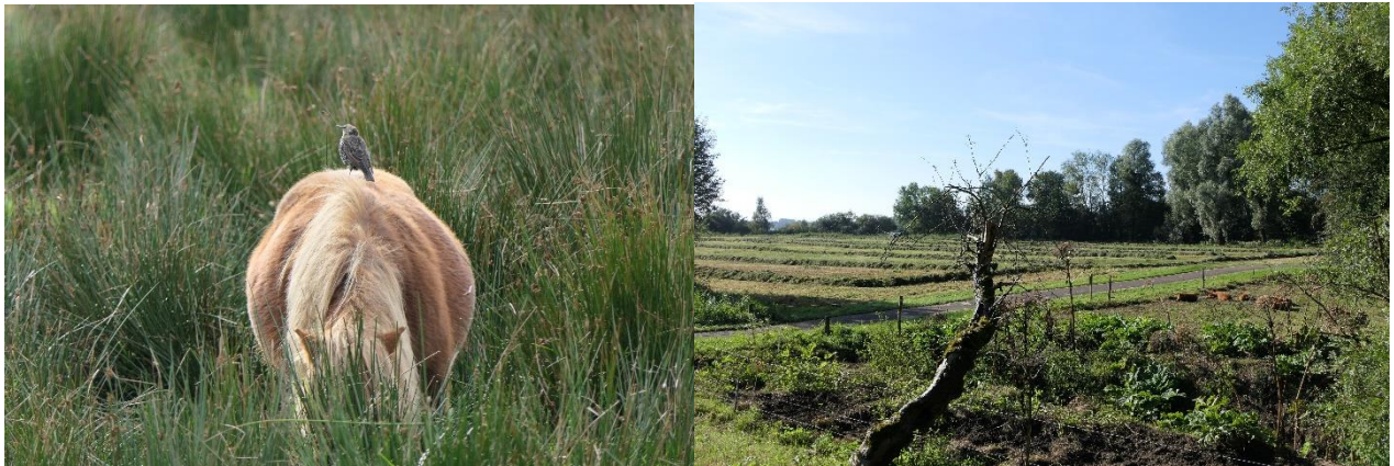
(spreeuw op de pony bij hoornsedijk en varkens tegen bereklauw en hooiwiersen langs hoornsedijk)

Tevens gebruiken we verschillende veesoorten voor begrazing. Dit jaar hebben we een experiment met lama's gedaan in de buurt van de Hoornseplas.