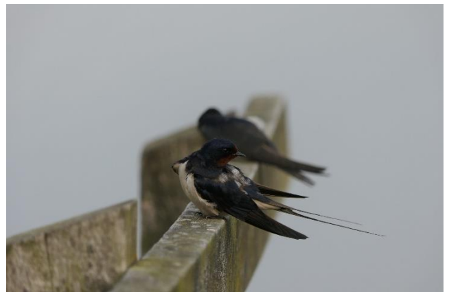
(ree bij hoornsediëp en boerenzwaluw bij molen)