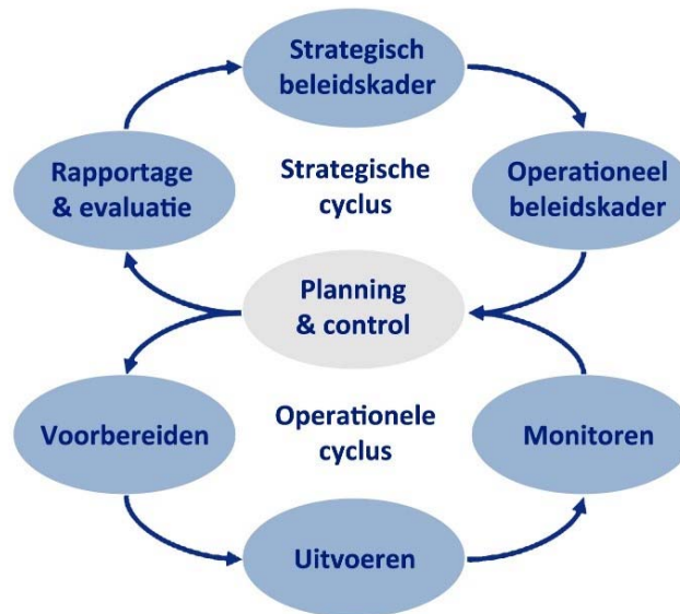
Figuur 2: Schematisch overzicht van de Big8-cyclus.

In de Wet algemene bepalingen omgevingsrecht (Wabo) en het Besluit omgevingsrecht (Bor) worden eisen gesteld aan de inhoud van beleid rond vergunningverlening, toezicht en handhaving (VTH). Het overheidsoptreden met betrekking tot de verlening van omgevingsvergunningen, het toezicht op naleving en de handhaving van het omgevingsrecht dient volgens deze regelgeving uniform en integraal plaats te vinden. Daarnaast is de verplichting vastgelegd om het handhavingsbeleid uit te werken in jaarlijkse uitvoeringsprogramma's (VTH-programma). Deze papieren cirkel van sturing en evaluatie wordt de Big8-cyclus genoemd (zie onderstaand schema).