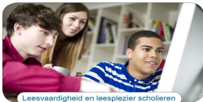
Leesvaardigheid en leesplezier scholieren