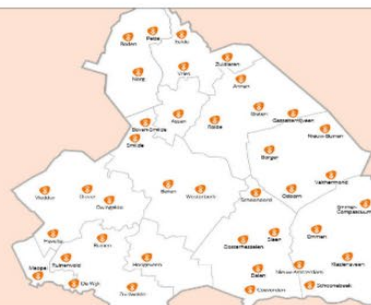
Zorgplicht voor bibliotheken