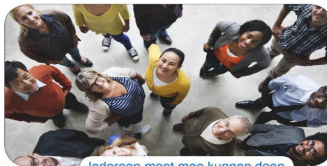
Iedereen moet mee kunnen doen