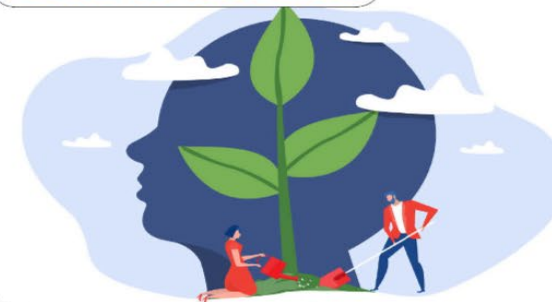
Aandacht voor brede welvaart