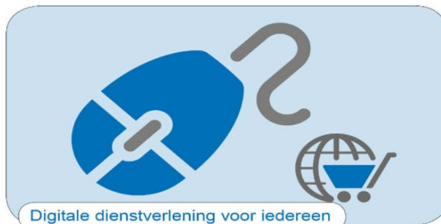
Digitale dienstverlening voor iedereen